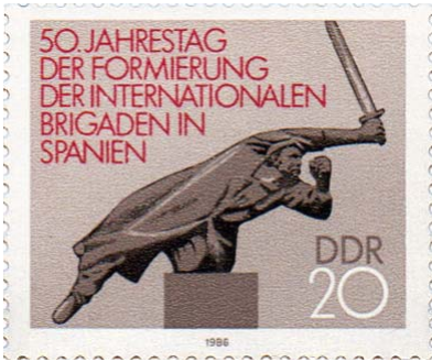
DDR-Briefmarke von 1986. „50. Jahrestag der Formierung der Internationalen Brigaden in Spanien“

Am 7. September 1968 marschieren im Ostberliner Volkspark Friedrichshain Ehrenformationen der nationalen Volksarmee, der DDR Volkspolizei und Kampfgruppen der Betriebe auf. Mit militärischem Zeremoniell wird am Rande des Parks eine Gedenkstätte für deutsche Spanienkämpfer eingeweiht. Die überlebensgroße Figur eines Brigadisten und eine Relieftafel mit Szenen aus dem Bürgerkrieg sollen hier an den Kampf der deutschen Freiwilligen auf Seiten der spanischen Republik gegen Franco erinnern. Mit der künstlerischen Gestaltung der Gedenkstätte ist der Vizepräsident der Akademie der Künste, der Bildhauer Fritz Cremer beauf-