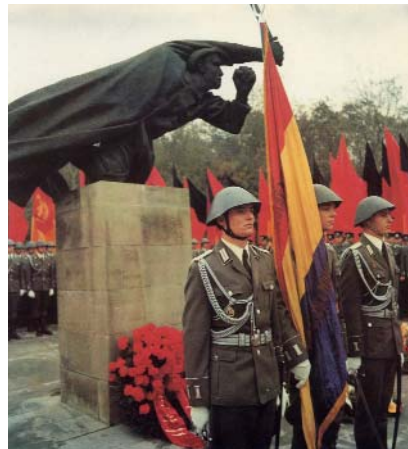
Eine Delegation der nationalen Volksarmee mit der Fahne der Spanischen Republik.

Zum 50. Jahrestag der Formierung der Internationalen Brigaden 1986 legt Erich Honecker einen Kranz am Denkmal nieder. Die DDR Elite inszeniert den Einsatz der „Antifaschistischen Widerstands-kämpfer“ in Spanien als ersten Schritt