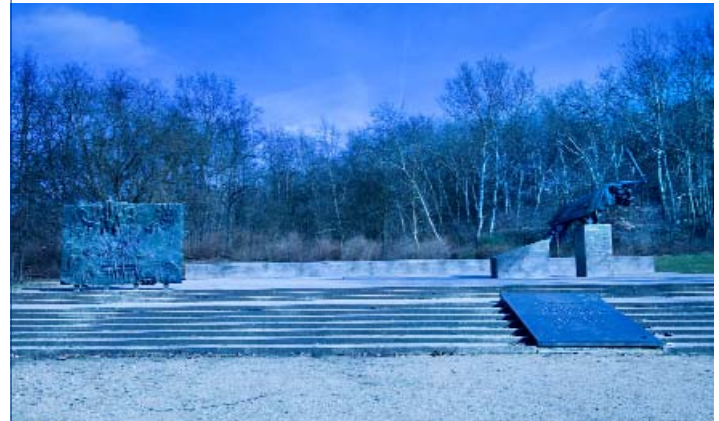
Ein Ehrenmahl aus drei Teilen: Relief, Gedenktafel und Skulptur.